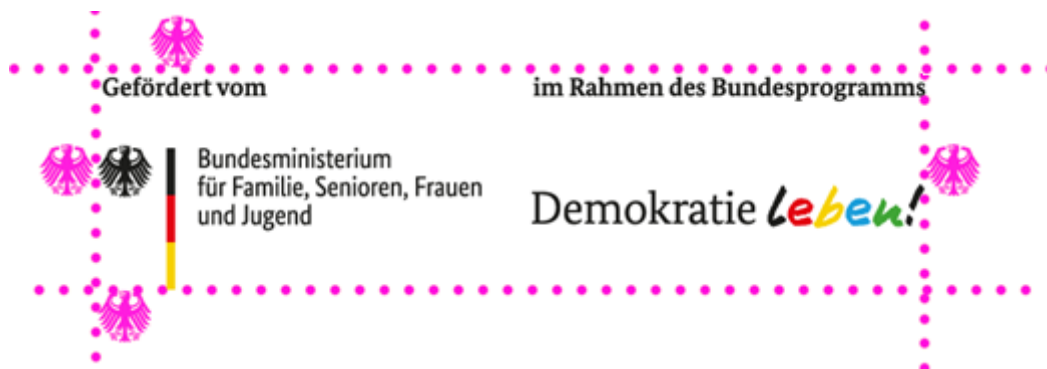
Illustration: Schutzraum um das Logo

in der kein anderes Element platziert werden darf. Die Schutzzone hat zu jeder Seite hin die Breite von einem Adlerelement.